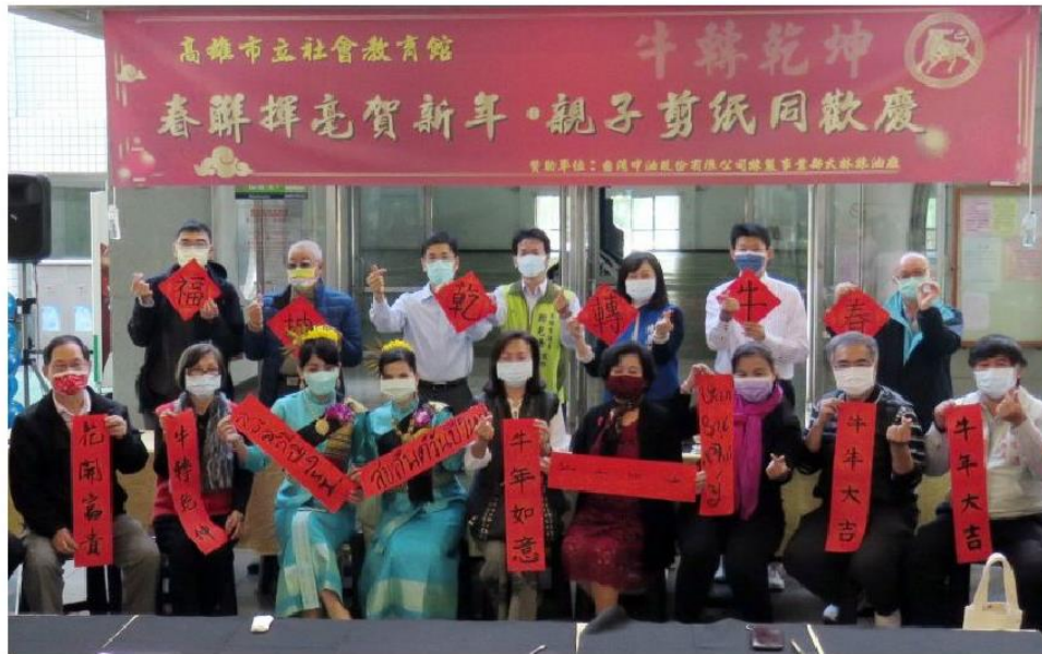
社教館春聯揮毫賀新年，吸引數百位市民到場索取，沾染新春喜氣。