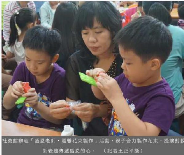
社教館辦理「感恩老師·溫馨花束製作」活動，親子合力製作花束，提前對教師表達傳遞感恩的心。（記者王正平攝）

高雄市社教館十七日辦理「感恩老師·溫馨花束製作」親子活動，運用輕質土、泡泡土等材料製作可愛的花束擺飾作品，藉以表達對教師的感恩與敬重，吸引二百多位親子參與，一同體驗樂在DIY的假日時光。